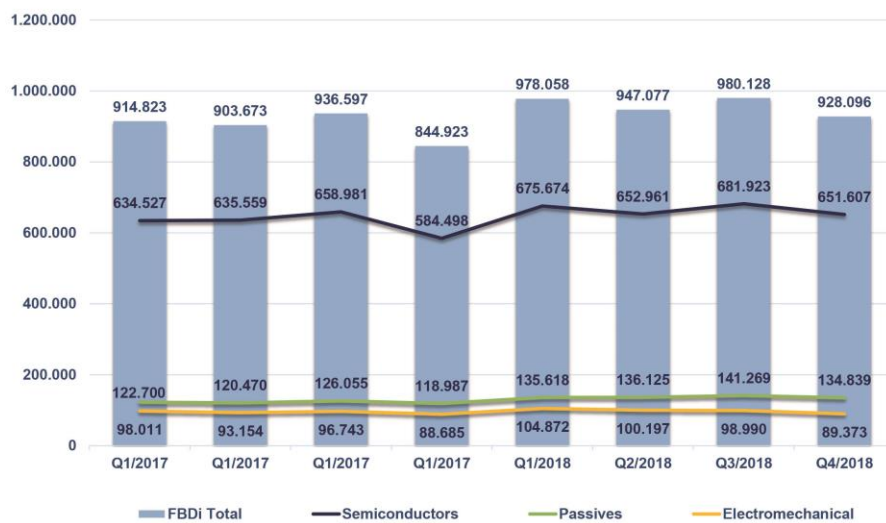
FBDi Germany by Product Group